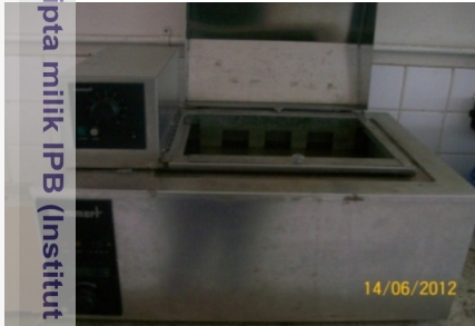
Shaker Water Bath