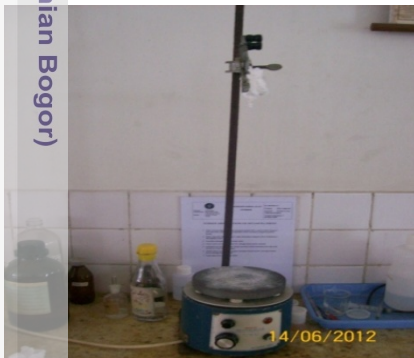
Alat Titrasi NH 3