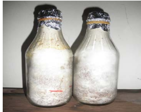
Bibit untuk Inokulasi