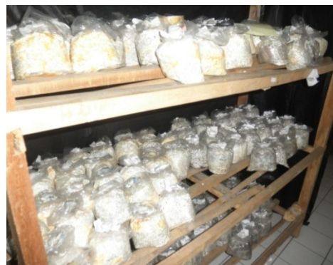
Rak untuk fermentasi