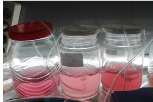
Kultur Porphyridium cruentum