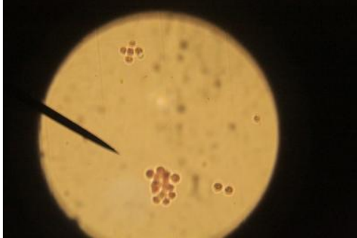
Sel Porphyridium cruentum