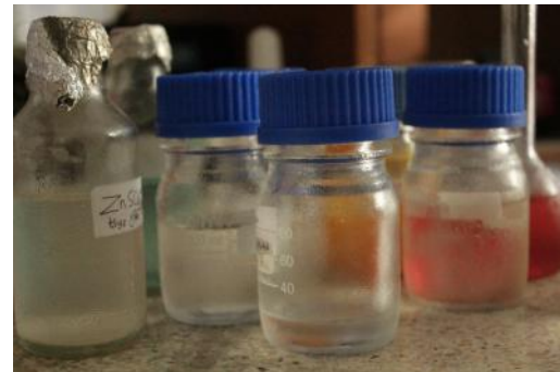
Media kultur Porphyridium cruentum