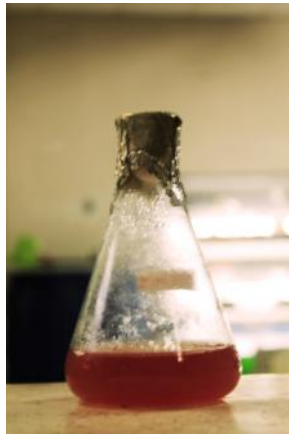
Benih Porphyridium cruentum