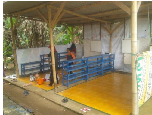
Gambar 10. Kelas PAUD CBS setelah program PKMM