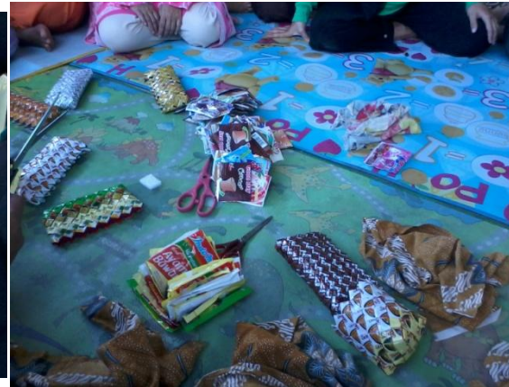
Gambar 2. Beberapa hasil kerajinan buatan para ibu wali murid