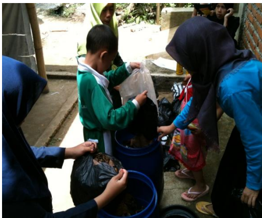
Gambar 3. . Pendampingan oleh tim PKMM dalam pembuatan pupuk organik