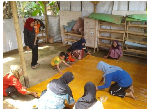
Gambar 8. Kerja bakti dalam perbaikan sarana prasarana