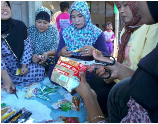
Gambar 1. Para ibu wali murid dalam pembuatan kerajinan dari limbah plastik