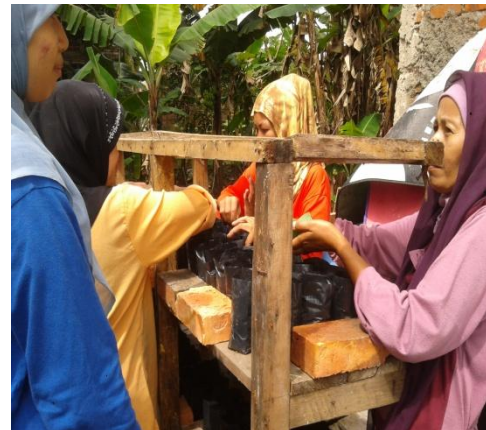
Gambar 4. Pendampingan oleh tim PKMM dalam penanaman sayur-sayur dengan metode pertanian organik sistem pot bersusun