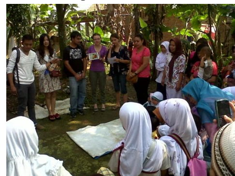
Gambar 6. Bermain sambil belajar bahasa inggris oleh mahasiswa luar negeri yang di dampingi tim PKM dan tim AIESEC IPB