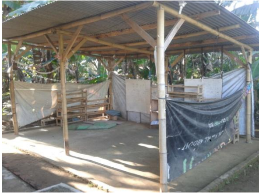
Gambar 7. Kelas PAUD CBS sebelum program PKMM