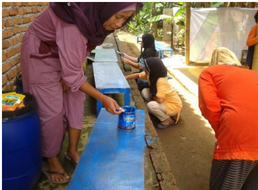
Gambar 9. Kerja sama cat meja belajar