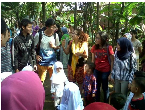
Gambar 5. Pembelajaran bahasa inggris dasar langsung oleh mahasiswa luar negeri yang di dampingi tim PKM dan tim AIESEC IPB