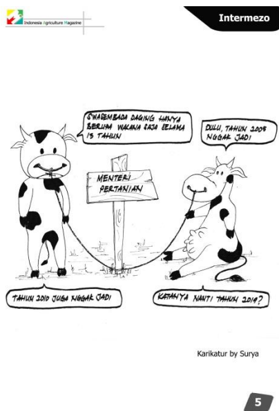
Gambar 1. Rubrik Karikatur