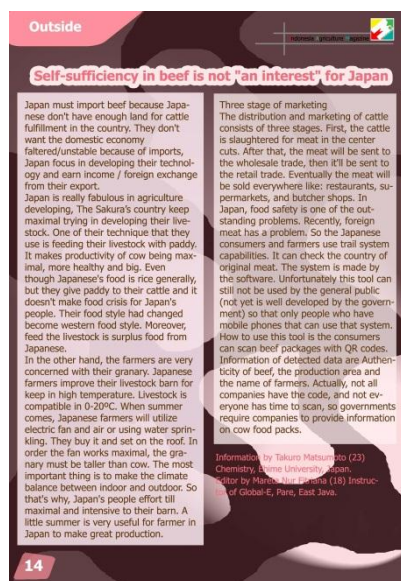
Gambar 4. Outside