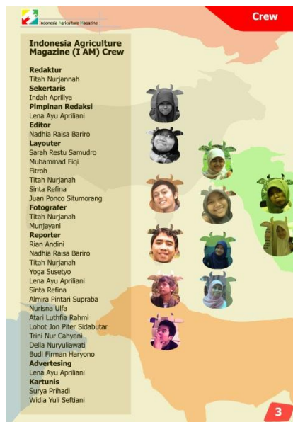
Gambar 2. Crew