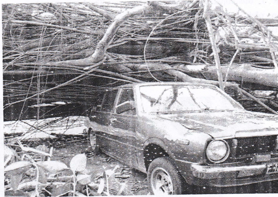
Gambar 3. Pohon beringin karet ( Ficus elastica ) tumbang ke arah halaman sekolah. Pohon ini telah menimpa beberapa kendaraan yang sedang diparkir di halaman sekolah, masih beruntung tidak menimbulkan korban jiwa karena kendaraan tersebut diparkir tanpa ada orang di dalamnya.