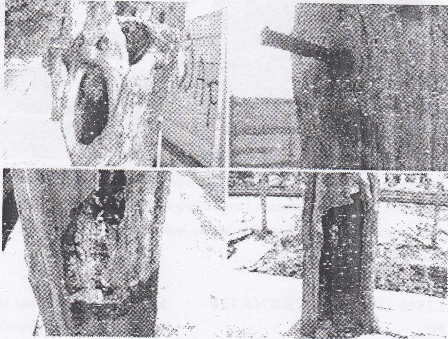
Gambar 1. Gangguan kesehatan pohon yang dilakukan oleh manusia tak bertanggung-jawab.

Tumbangnya pohon pada gambar 2 dipicu oleh adanya angin kencang pada pagi hari. Pohon ini telah menimpa sebuah tempat peribadatan, dan merusak sarana jalur jalan. Tidak ada korban jiwa pada peristiwa ini.