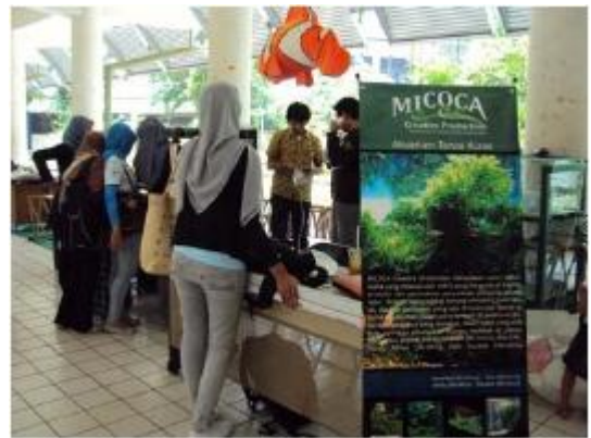
Suasana Bazar PKM