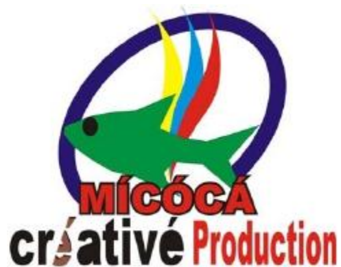
Logo Micoca Production