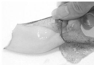
Gambar 3. Kulit cumi-cumi