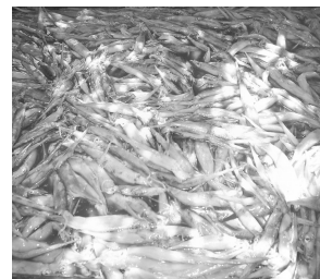
Gambar 4. Hasil tangkapan cumi-cumi