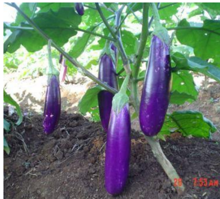
Gambar 1 Buah Terung Ungu (Dwi 2010).

Kingdom : Plantae Divisi : Spermatophyta Sub Divisi : Angiospermae Class : Magnoliopsida Subclass : Asteridae Order : Solanales Family : Solanaceae Genus : Solanum Spesies : S. melongena Nama binomial: S. melongena L. (Bisby 2004)