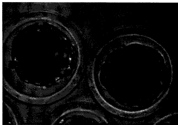
Gambar 1. Embrio sapi perah FH stadium morula bermutu A laik beku dalam keadaan segar prapembekuan (foto mikroskopis 15x40)

Seluruh embrio beku pascapencairan dibagi menjadi empat kelompok dan masing-masing embrio beku dibilas, untuk membebaskan embrio dari krioprotektan. Pembagian kelompok didasarkan atas perlakuan pembilasan yakni dibilas langsung dengan media pemupukan modified Dulbecco's phosphate buffered saline (MPBS, Nissui, Japan) 10% fetal