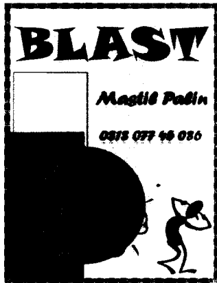
Gambar Name tag bazar