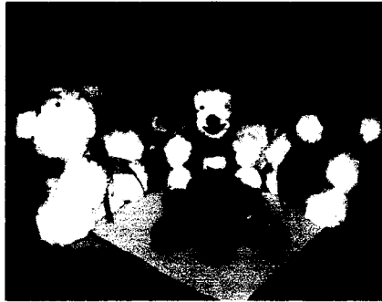
Gambar bOpA setelah aksesoris