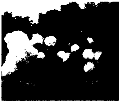
Gambar bOpA sebelum aksesoris