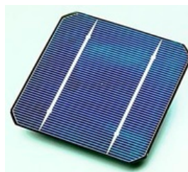
Gambar 1. Sel Surya

Apabila sel surya itu dikenakan pada sinar matahari, maka timbul yang dinamakan elektron dan hole . Elektron-elektron dan hole-hole yang timbul di sekitar p-n junction bergerak berturut-turut ke arah lapisan n dan ke arah lapisan p. Sehingga pada saat elektron-elektron dan hole-hole itu melintasi p-n junction , timbul beda potensial pada kedua ujung sel surya. Jika pada kedua ujung sel surya diberi beban maka timbul arus listrik yang mengalir melalui beban.