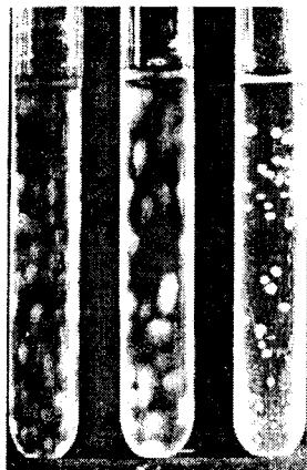
Gambar 1. Bentuk Koloni Difus SGC Berkapsul (SGC 5.60 dan 6.29) dan Bentuk Koloni Kompak SGC Tidak Berkapsul (MAS B).

Semua isolat yang menunjukkan koloni mukoid tumbuh ke-ruh di media cair dan difus dalam agar lunak, sedangkan isolat dengan koloni kecil dan kasar tumbuh dalam bentuk sedimen dengan supernatan jernih pada media cair serta berkoloni kompak dalam agar lunak (Tabel 2; Gambar 1). Hasil serupa telah diamati pula pada streptokokus grup B dan D (Wibawan dan Lämmler, 1990; 1992). Bentuk pertumbuhan bakteri dapat digunakan untuk menentukan keberadaan kapsul pada bakteri streptokokus. Keberadaan kapsul yang dikaitkan dengan bentuk pertumbuhan bakteri SGC ini lebih lanjut ditegaskan dengan studi elektron mikroskop. Pola pertumbuhan bakteri keruh diduga berkaitan dengan formasi rantai bakteri yang umumnya lebih pendek (5-7 bakteri/rantai) dibandingkan dengan bakteri SGC yang tumbuh membentuk sedimen (>20 bakteri/rantai). Bentuk rantai panjang bakteri menyebabkan pertumbuhan dalam bentuk sedimen.