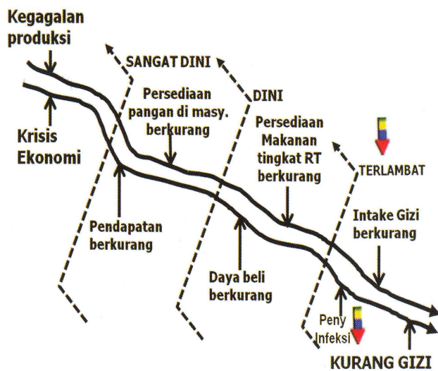
Gambar 2. Klasifikasi Penanganan Krisis Pangan dan Gizi Menurut Kerangka Kerja yang Dikembangkan oleh SKPG (Depkes, 2009).

bertujuan untuk menyediakan informasi bagi penentuan kebijakan, perencanaan program dan penetapan tindakan dalam penanganan masalah pangan dan gizi. Keberadaan SKPG sudah ada sejak tahun 1970-an. Pada awalnya SKPG dikembangkan oleh Kementerian Kesehatan dan saat ini dilanjutkan oleh BBKP dengan tujuan utama untuk memantau keadaan pangan dan gizi di masyarakat.