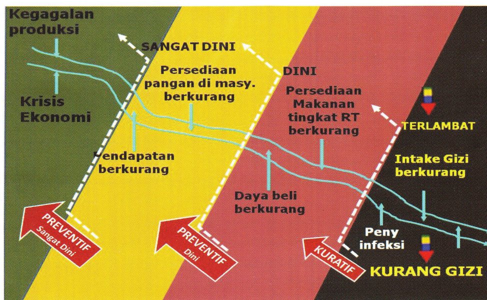
Gambar 4. Gradasi Situasi Kerawanan Pangan dan Gizi Serta Skema Penanganannya

Seperti telah disampaikan sebelumnya, skema penanganan dampak krisis pangan dan gizi yang dikembangkan didasarkan pada kerangka kerja SKPG. Dengan menggunakan kategori yang sudah ada (Gambar 3), maka visualisasi situasi pangan dan gizi bersama dengan skema penanganannya dapat disajikan pada Gambar 4. Secara umum tingkat pelaksanaan krisis pangan dan gizi penanganan dibedakan menjadi tiga kategori yaitu: wilayah