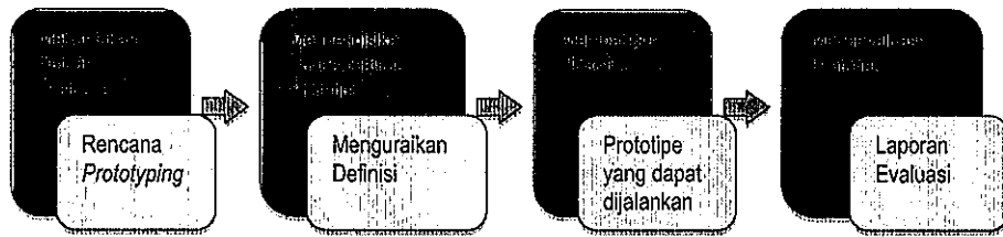
Gambar 1 Proses pengembangan prototipe