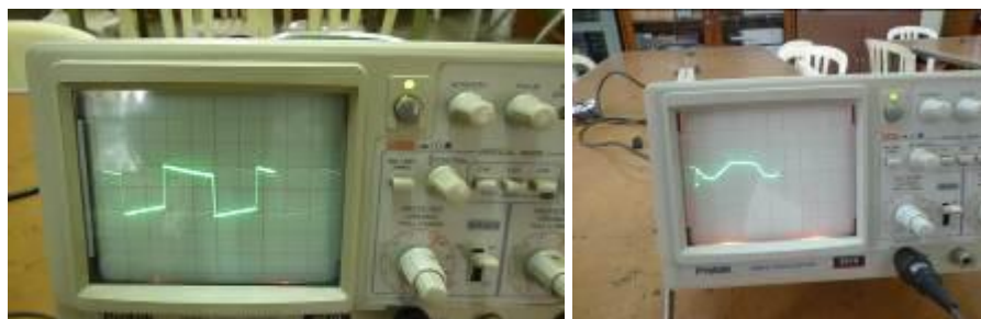
Gambar 1. Hasil Ujicoba Laboratorium