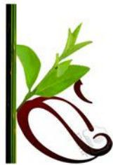
Gambar 1. Logo Kawa Green Coffee