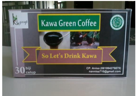
Gambar 5. Kemasan luar 30 biji celup