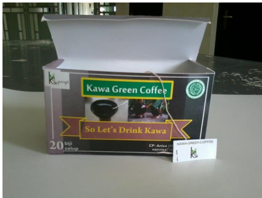
Gambar 4. Kemasan Luar 20 biji celup