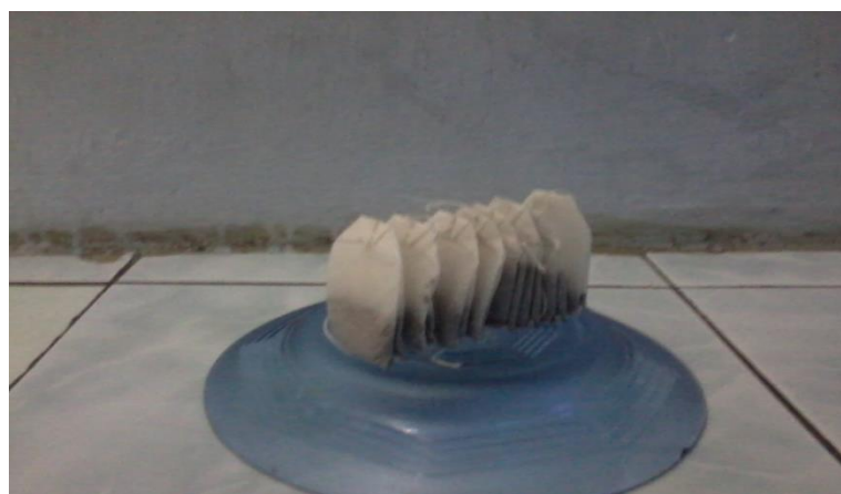
Gambar 3. Kemasan Celup Kopi Daun