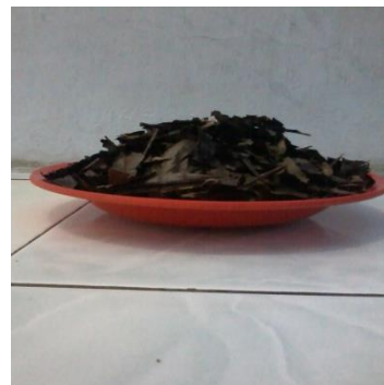
Gambar 2. Daun Kopi