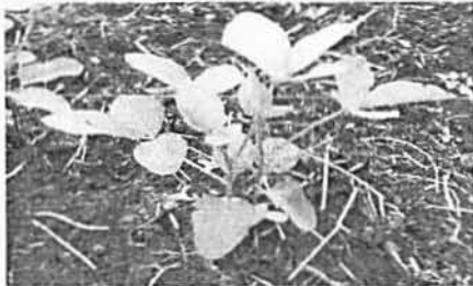
(a). Daun trifoliolate dan oval (normal)

Perubahan yang bersifat kualitatif ini terjadi pada beberapa tanaman dari perlakuan dosis iradiasi 150 dan 200 Gy. Hal yang sama juga terjadi pada induksi mutasi dengan iradiasi sinar gamma pada kedelai (Manjaya and Nandawar, 2007) dan kacang hijau (Sangsiri et al. , 2005) yang menunjukkan terjadinya perubahan pada bentuk dan warna daun serta bentuk dan warna bunga dan ada juga menimbulkan sterilitas pada tanaman.