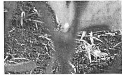
(e). Bunga ungu (normal)