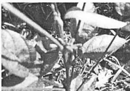
(d). Rasim bunga dan tunas (tidak berkembang)