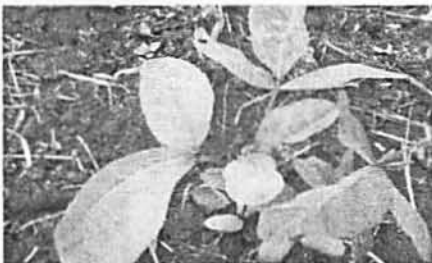
(b). Daun bifoliat dan memanjang