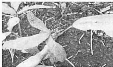
(c). Daun unifoliat dan memanjang