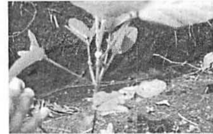
(f). Bunga putih