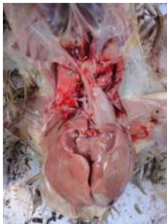
Gambar 3 Adanya air sacculitis pada ayam yang terinfeksi M. gallinarum

Ayam sakit yang diperoleh dari pengamatan kemudian dinekropsi. Dari hasil tersebut terlihat bahwa hampir semua yang mengalami kesakitan ditemukan air sacculitis dan tracheitis . Kelompok yang mengalami kesakitan (morbiditas) tinggi yakni 100% terjadi pada kelompok kontrol positif yang tidak diberi antibiotik D-3. Sedangkan pada ayam yang diinfeksi M. gallinarum dengan pemberian antibiotik D-3 pada kelompok A1, kelompok A2, dan kelompok A3 tidak ada gejala kesakitan pada kelompok yang signifikan dengan tingkat morbiditas yang rendah (lihat Tabel 2 ).