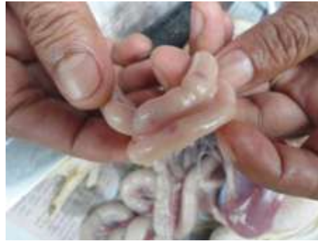
Gambar 1 Patologi usus ayam yang terinfeksi E. coli tanpa pemberian antibiotik D-3 (kontrol positif)

Pemeriksaan patologi anatomi khususnya pada usus ayam terjadi peradangan (enteritis) dengan ditemukannya petechiae di daerah usus. Bahkan menurut penelitian yang telah dilakukan Wibowo dan Wahyu (2008), ayam yang telah terinfeksi E. coli pada pemeriksaan patologi anatomi ditemukan adanya peritonitis, perihepatitis, dan perikarditis dengan tingkat keparahan yang bervariasi. Kelompok ayam yang diinfeksi E. coli tanpa pemberian antibiotik D-3 (kontrol positif) menunjukkan persentase morbiditas 100%. Sedangkan pada ayam yang diinfeksi E. coli dengan pemberian antibiotik D-3 pada kelompok E1, kelompok E2, dan kelompok E3 tidak ada gejala kesakitan yang signifikan dengan tingkat morbiditas yang rendah (lihat Tabel 1).