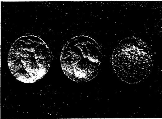
Gambar 2. (A) Pati tapioka, (B) sagu dan (C) kelapa sawit

jauh berbeda dengan pati sagu dapat dilihat pada Gambar 2. Perbedaan derajat putih ini disebabkan karena sumber atau jenis asal dari patinya, dimana tapioka berasal dari akar sedangkan sawit dan sagu berasal dari batang. Derajat putih pati kelapa sawit ini lebih rendah dari tapioka diduga karena batang kelapa sawit mengandung senyawa polifenol demikian juga pati sagu. Hasil penelitian Pei-Lang et al. (2006) menyatakan pencoklatan pati sagu disebabkan oleh senyawa fenol dan polifenol oksidase di dalam batang. Menurut Ozawa dan Arai (1986) diacu dalam Pei-Lang et al. (2006) senyawa fenol yang berperan dalam reaksi pencoklatannya adalah DL-epikatekin dan D-katekin.