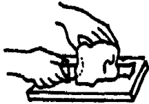
Gambar 1. : Penyayatan/Pengirisan Daging