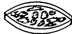
Gambar 4. Penjemuran Dendeng