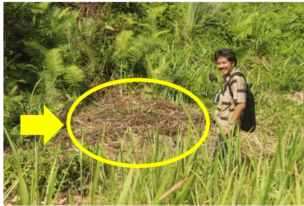
Gambar 3 Sarang tempat babi hutan betina melahirkan anak-anaknya