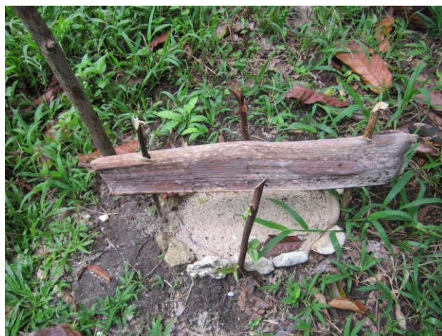
Gambar 11 Pengendalian metafisik menggunakan simbol kuburan

Beberapa bahan digunakan oleh sebagian kecil petani di Pulau Gebe untuk mengancam para pencuri produk pertaniannya (Gambar 11). Salah satunya adalah penggunaan simbol kuburan yang menunjukkan bahwa kematian adalah sanksi terberat bagi para pencuri, baik manusia maupun satwa liar.