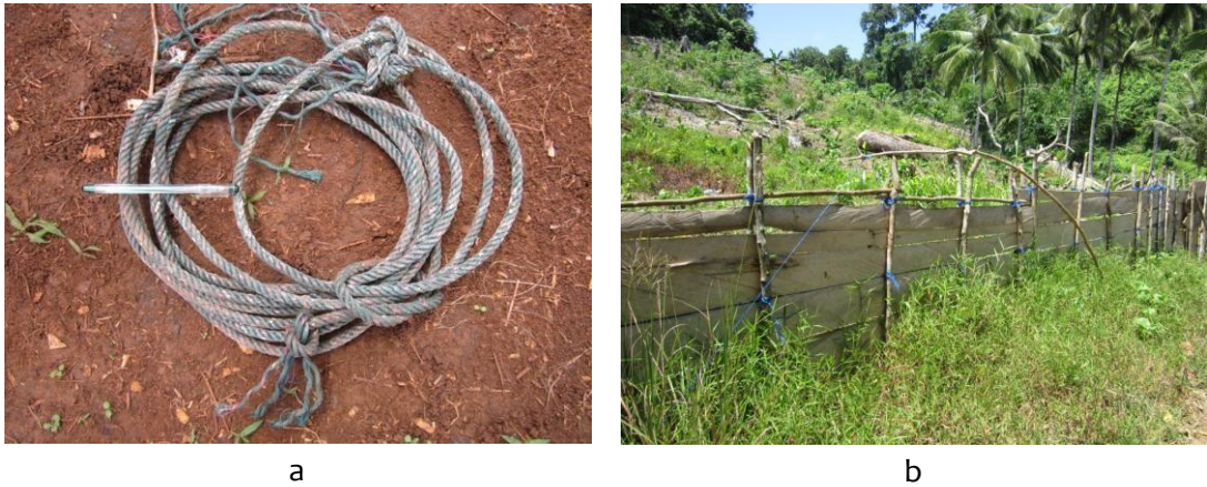
Gambar 8 Jerat dari tali baja (a) dan yang dipasang di sekitar pertanaman (b)

mengusir babi hutan (Gambar 9b). Bau bahan kimia tertentu kemungkinan dapat mengusir babi hutan dari suatu habitat. Hal ini perlu dilakukan penelitian lebih lanjut.