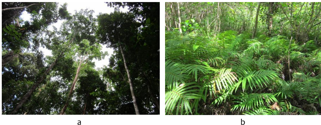
Gambar 2 Habitat babi hutan pada hutan primer (a) dan semak belukar (b)

Habitat babi hutan adalah hutan primer (Gambar 2a), hutan sekunder, semak belukar (Gambar 2b), padang alang-alang, dan pertanaman atau perkebunan yang tidak terurus. Habitat yang dipilih terutama berhubungan dengan sumberdaya, yaitu ketersediaan pakan dan dekat dengan sumber air sebagai tempat untuk berkubang. Babi hutan selalu melakukan aktivitas berkubang setiap hari dan relatif tidak tahan terhadap panas matahari. Perpindahan habitat yang dilakukan oleh babi hutan berkaitan dengan pakan yang sudah tidak tersedia lagi dan tempat berkubang yang sudah mengering (Priyambodo 1990).