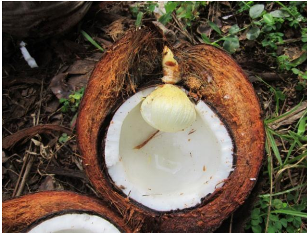
Gambar 1 Bagian endosperma kelapa yang disukai oleh babi hutan

Selama pengelolaan tambang nikel oleh PT Antam Tbk., babi hutan menjadi hama penting pada pertanaman kelapa dan juga pada pertanaman palawija dan sayur-sayuran. Babi hutan menyerang bibit kelapa yang baru ditanam di lahan dengan merusak titik tumbuh dan makan bagian endosperma yang dalam bahasa Jawa disebut kenthos (Gambar 1).