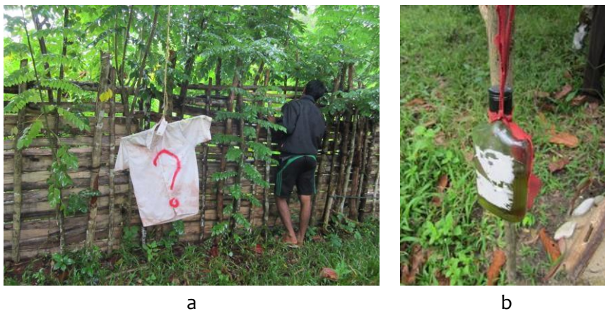
Gambar 9 Repelen dari pakaian orang dewasa (a) dan ramuan khusus (b)