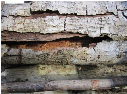
Gambar 6 Pagar papan yang sudah lapuk