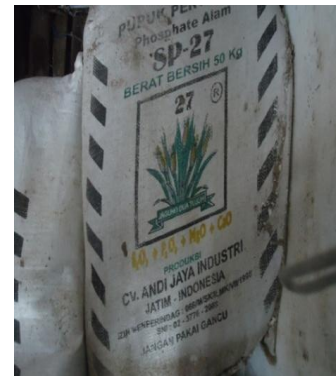
Gambar 3. Pupuk SP-27 yang tidak terdaftar di Pusat Perizinan dan Investasi Kementerian Pertanian RI

Selain itu, di Kecamatan Citamiang juga ditemukan pupuk P yang tidak berkualitas yaitu SP-27 dengan kandungan P_2O_5 totalnya hanya sebesar 0.36%, dan tidak terdaftar di Kementerian Pertanian RI (Gambar 3).