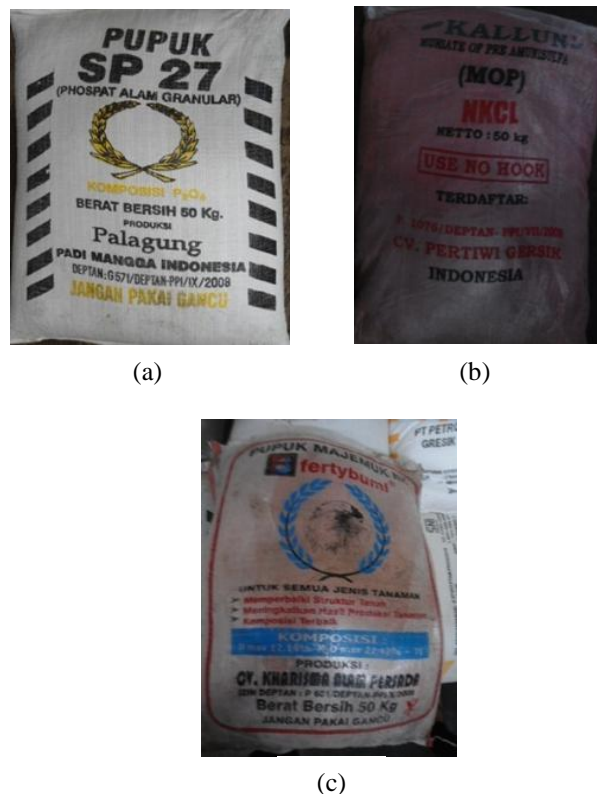
Gambar 1. Kemasan pupuk SP 27 (a), NKCl Kalun (b) dan NK Fertybumi (c) yang tidak mencantumkan kadar unsur hara yang dikandung pupuk tersebut.

Berdasarkan hasil pengamatan di lapangan, ternyata di kios penyalur pupuk resmi, tidak saja dijual pupuk P dan K yang berkualitas, tetapi juga banyak sekali pupuk P dan K yang tidak berkualitas yang dipasarkan kepada petani. Di Kabupaten Cianjur dijumpai pupuk P dan K, seperti SP 27 produksi Palagung, NK Fertybumi, dan NKCl Kalun (Gambar 1) yang tidak mencantumkan kadar P_2O_5 maupun kadar K_2O pada karungnya. Hal ini mengakibatkan petani pembeli tidak bisa mengetahui mutu dari pupuk tersebut.