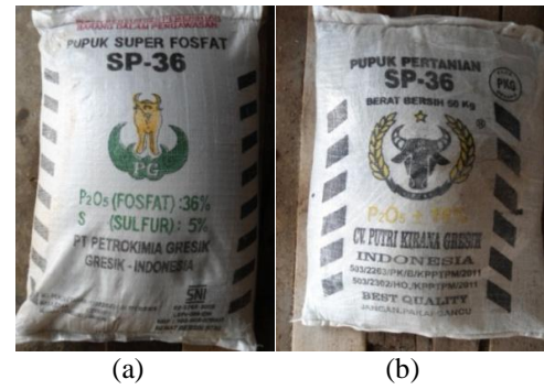
Gambar 2. Pupuk SP-36 yang disubsidi Pemerintah (a), dan pupuk “SP-36” yang dikemas mirip dengan pupuk SP-36 bersubsidi (b)

Pupuk P yang tidak berkualitas ini dijual dengan harga berkisar dari Rp 800 sampai Rp 2,000 kg^{-1} (Tabel 4). Harga penjualan pupuk P yang tidak berkualitas ini hampir menyamai harga pupuk SP-36 yang berkualitas dan bersubsidi yaitu berkisar dari Rp 2,000 sampai Rp 2,500 kg^{-1} (Tabel 3). Tentu saja tindakan ini merugikan petani bukan saja dari harga yang tinggi, kualitas pupuk yang tidak baik tetapi juga panen petani yang pasti tidak sesuai dengan yang diharapkan petani.