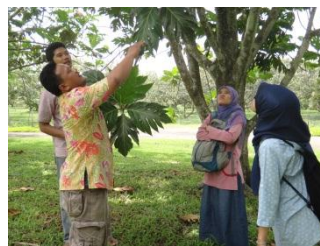
Pencarian bahan baku ke taman buah