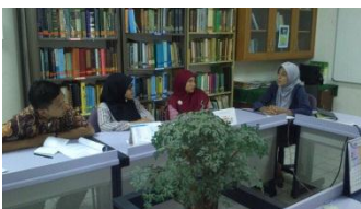
Konsultasi dengan pembimbing