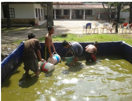
Gambar 5. Menguras dan mengganti air