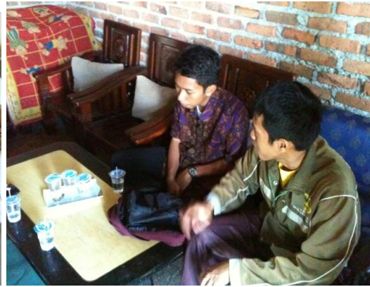
Gambar 2. Diskusi dengan pihak panti