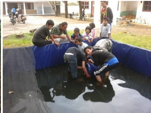
Gambar 4. Penebaran bibit ikan lele