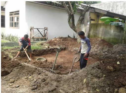
Gambar 3. Proses pembuatan kolam