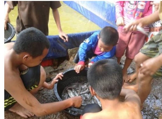
Gambar 6. Proses penyortiran