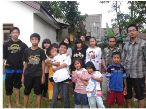
Gambar 8. Foto bersama bersama pihak panti Kosgor