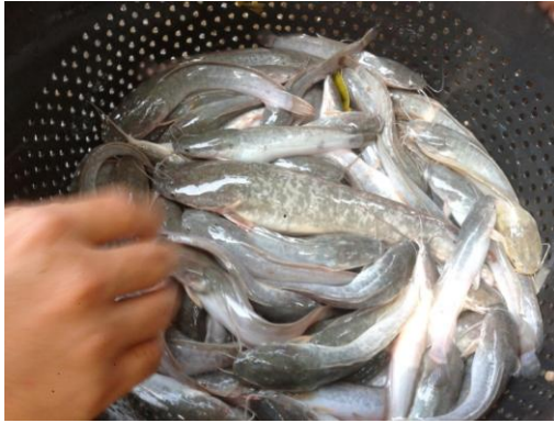
Gambar 7. Kondisi lele saat penyortiran