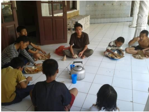
Gambar 1. Penjelasan rencana kerja