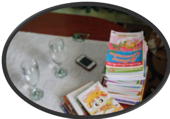
Gambar 5 Buku yang di sumabngkan ke Bengkel Baca