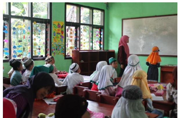
Gambar 6 Suasana belajar di kelas bersama putra putri desa Gunung Bunder