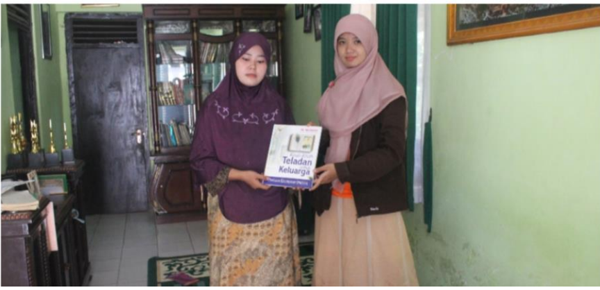
Penyerahan buku bacaan ke Ibu Guru PAUD Desa Gunung Bunder I