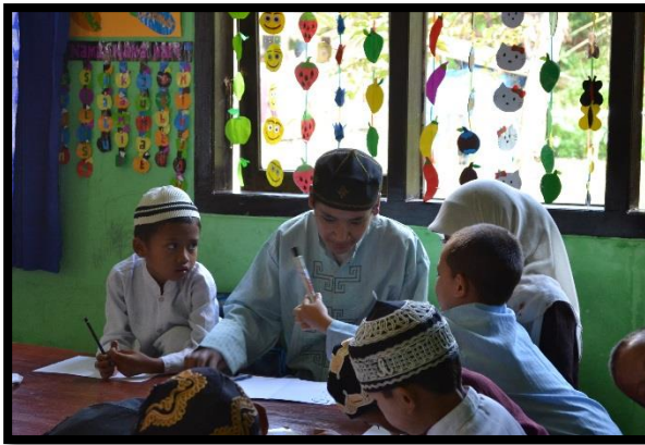
Gambar 3 Kenali huruf A-Z