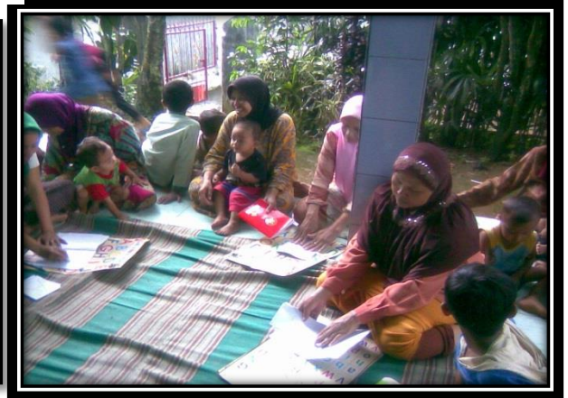
Gambar 4 Belajar bersama Ibu-Ibu rumah tangga yang buta aksara