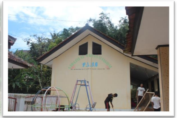
Gambar 2 Tempat belajar sementara di PAUD