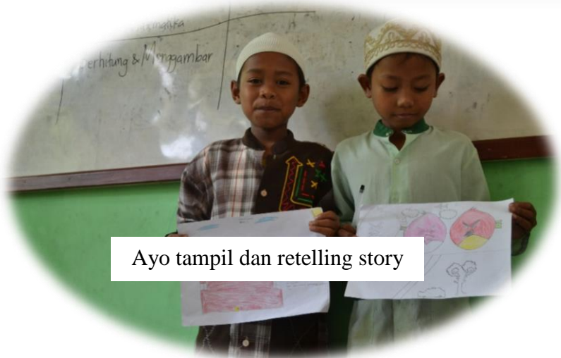
Ayo tampil dan retelling story