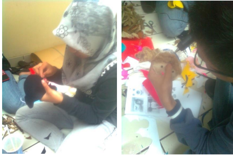
Produksi si Bonar