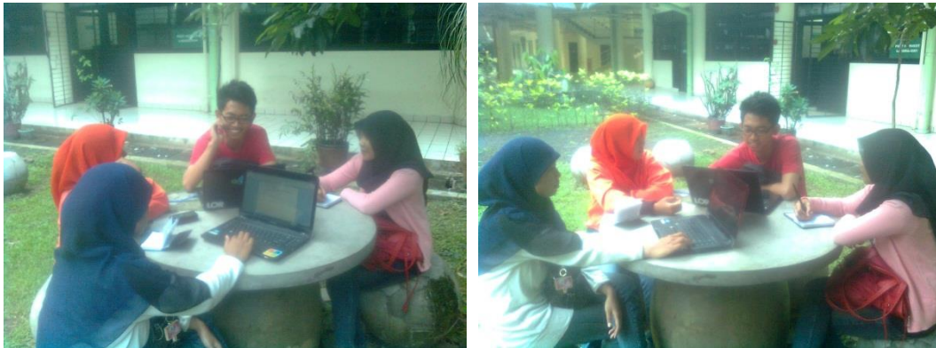
Perencanaan Produksi si Bonar