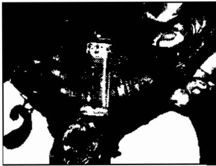
Gambar 3. Cakar dan telapak kaki depan beruang madu ( Helarctos malayanus ) yang digunakan sebagai bukti keaslian empedu beruang madu.

ular sanca. Semakin besar ukuran empedu, maka harga jualnya semakin mahal. Empedu yang berukuran kecil pada umumnya dijual dengan harga MYR 200 (Rp 555.500) 3 , sedangkan yang berukuran besar dijual dengan harga MYR 400 (Rp 1.110.900,-). Masyarakat di sekitar kawasan TNBK juga meyakini bahwa empedu ular sanca memiliki khasiat yang hampir sama dengan empedu beruang madu walaupun khasiatnya tidak sekuat empedu beruang madu. Kondisi ini menyebabkan terjadinya pemalsuan empedu beruang madu dengan empedu ular sanca. Oleh karena itu penjualan empedu beruang madu dari produsen (masyarakat) kepada pedagang (pembeli) harus disertai dengan bukti berupa cakar dan telapak kaki depan beruang madu (Gambar 3).