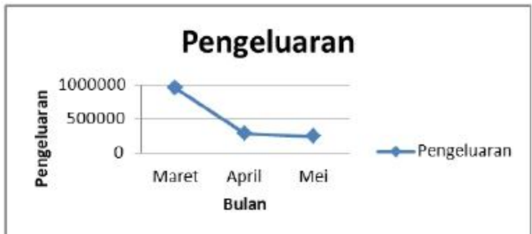
Gambar 4. Grafik pengeluaran selama tiga bulan produksi

Penjualan produk dilakukan selama lebih kurang dua bulan yaitu dari tanggal Maret sampai dengan April 2010. Besarnya pengeluaran selama dua bulan produksi dapat dilihat pada gambar 4 berikut.