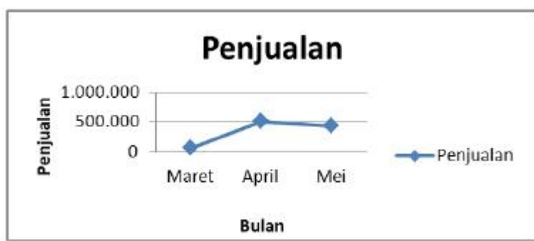
Gambar 5. Grafik penjualan selama tiga bulan produksi

Besarnya pemasukan yang diperoleh dari penjualan yang dilakukan selama tiga bulan dapat dilihat pada gambar 5 berikut: