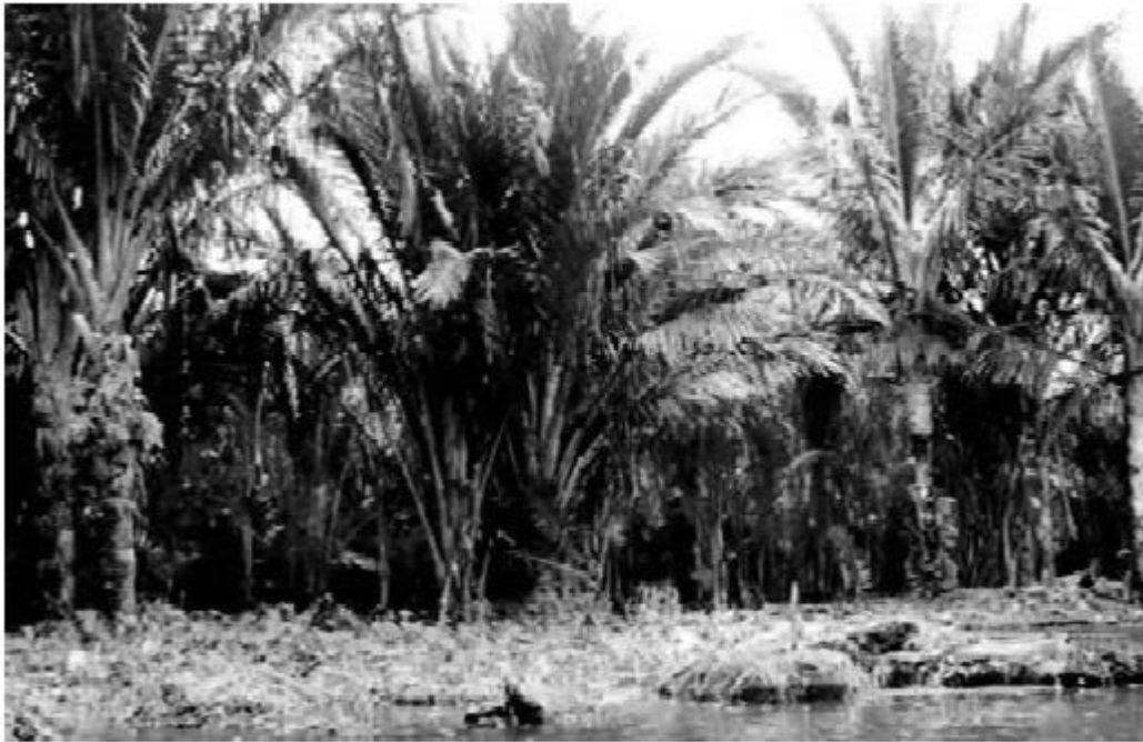
Gambar 1 Tanaman Sagu ( Metroxylon spp.)

Metroxylon. Maka sebutan pohon penghasil sagu juga mencakup berbagai genus palma. Genera palma yang tercakup disamping Metroxylon ialah Arecastrum ( Cocos ), Arenga (aren), Borassus (lontar), Caryota (nibung), Copernicia (gebang), ( Eugeissona (jato atau kajatoa, dayak, tunjang pipit, Melayu Kalimantan Barat), Manicaria , Mauritia , Phoenix (sebangsa kurma), dan Roystonea . Bahkan Cyas (pakis haji) yang bukan palma dimasukkan pula dalam kelompok pohon penghasil sagu (Deinim, 1948; Heyne, 1950; PERSAKI, 1965; Moore, 1973; Dissanayake, 1977; Ruddle, 1977; Dransfield, 1977; Johnson, 1977; Schuilin&Flach, 1985).