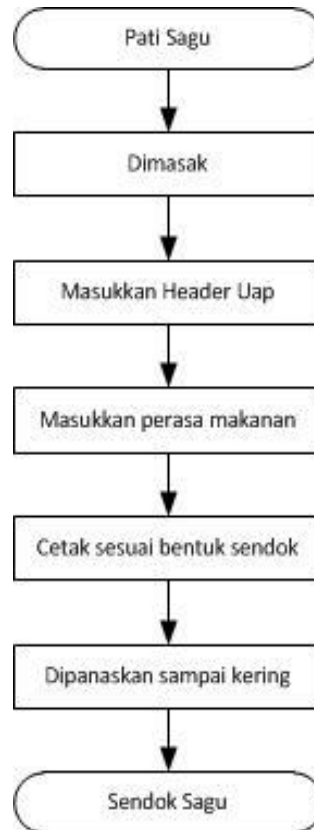
Gambar 3 Diagram alir pembuatan sendok edibel dari pati sagu

lain sebagainya. Proses pembuatan sendok yang terbuat dari sagu tidak susah sehingga dapat dimanfaatkan dalam skala rumah tangga ataupun industri.