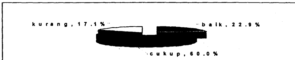
Gambar 1. Distribusi Pengetahuan Responden tentang Manfaat Mangrove, Tahun 2004

Pohon-pohon (mangrove) yang terlalu rapat (jumlah tegakannya banyak) dapat menutupi datangnya sinar matahari, sehingga kalau bisa jangan terlalu rapat –lah. Kalau sinar matahari kurang, jelek buat ikan-ikan.