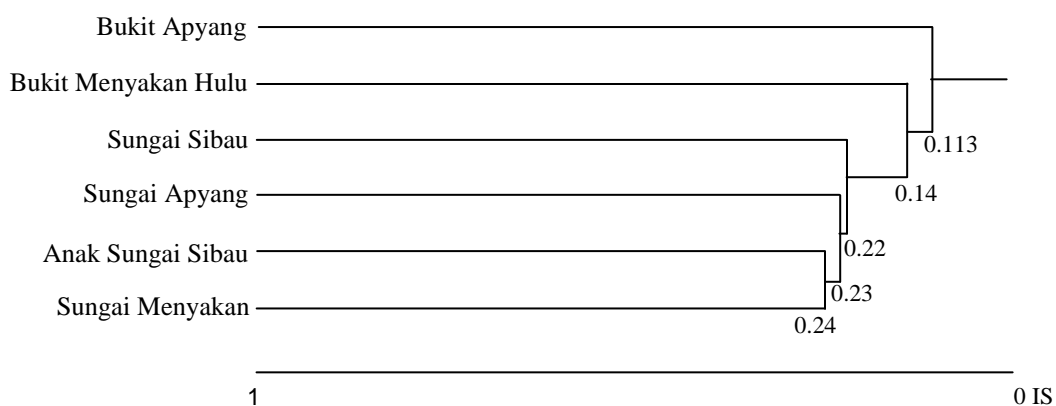
Gambar 2. Dendrogram kesamaan jenis burung antar lokasi di DAS Sibau, TNBK

Keterangan : SS = Sungai Sibau; SA = Sungai Apyang; SM = Sungai Menyakan; AS = Anak Sungai Sibau; BA = Bukit Apyang; BM = Bukit Menyakan Hulu