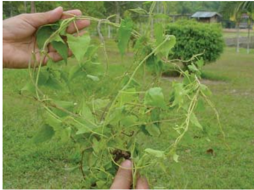
Daun cabe-cabe ( Asystasia spp)