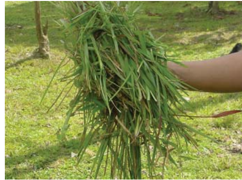
Rumput lapang ( Axonopus compressus )