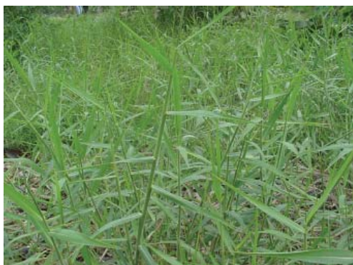
Rumput kolonjono ( Cynodon dactylon )