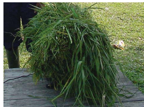
Rumput kumpai ( Hyampeacne amplexicaulis )