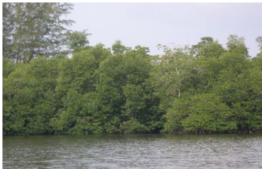
Gambar 2. Hutan Mangrove di Singkil