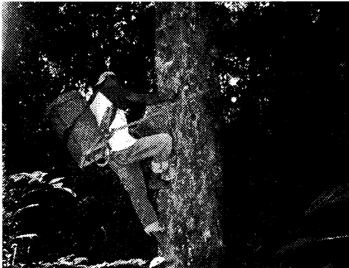
Gambar 2. Teknik Pemanenan Getah Damar