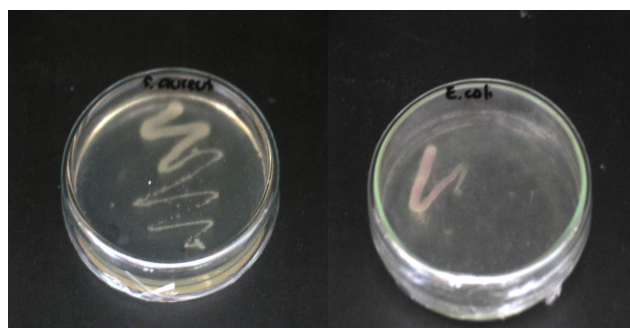
Gambar 1. Pengujian resistensi bakteri target

Pengujian resistensi mengacu pada standar NCCLS ( National Commitee for Clinical Laboratory Standard ). Konsentrasi ampisilin yang umum digunakan sebagai obat menurut NCCLS untuk bakteri E.coli adalah 8 \mu g/ml dan untuk bakteri S.aureus adalah 0,25 \mu g/ml. Hasil pengujian menunjukkan dapat menghambat pertumbuhan bakteri E.coli dan S.aureus koleksi Lab Bioteknologi Hasil Perikanan oleh ampisilin dengan konsentrasi diatas standar NCCLS yaitu > 32 \mu g/ml (Gambar 1).