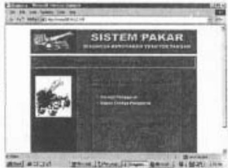
Gambar 4. Tampilan halaman aktif

dan Netscape 4.7. Dari hasil uji coba pada jaringan lokal ( Local Intranet ) yang terhubung dengan 6 client menunjukkan bahwa sistem dapat bekerja dengan baik dan menampilkan dialog yang benar dan tata letak tampilan sesuai dengan rancangan sistem.