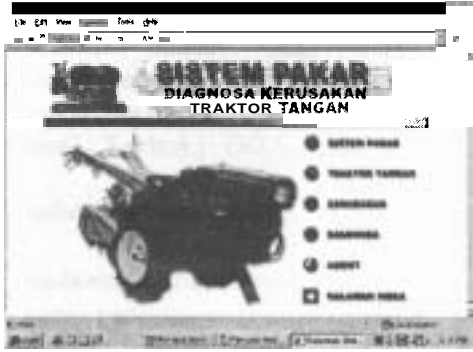
Gambar 2. Halaman Utama Sistem Pakar Diagnosa Kerusakan Traktor Tangan .

yang berasal dari 498 rule dengan penyederhanaan bentuk komunikasi dari langkah-langkah yang berbelit ke bentuk komunikasi dalam satu halaman.