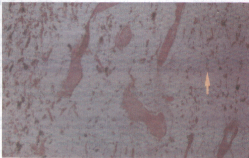
Gambar 2 : Fokus hemopoiesis pada kambing normal