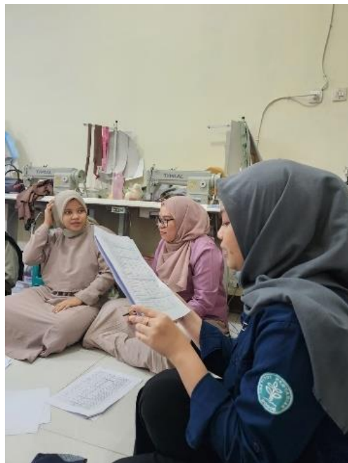
Lampiran 8.2 Mengambil data