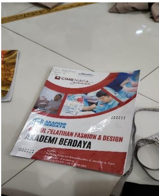
Lampiran 8.1. Buku saku peserta