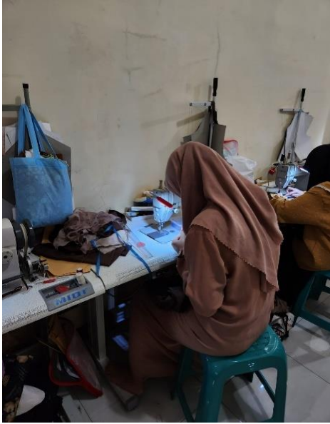
Lampiran 8.5. Kegiatan pelatihan