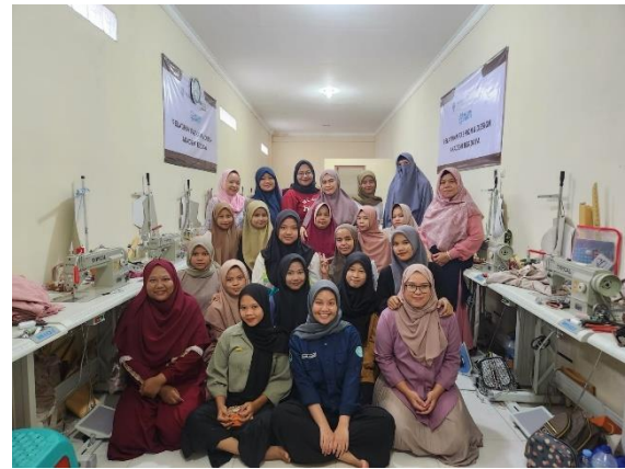
Lampiran 8.8 bersama responden