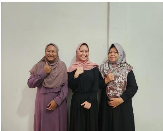
Lampiran 8.3 Foto bersama coach