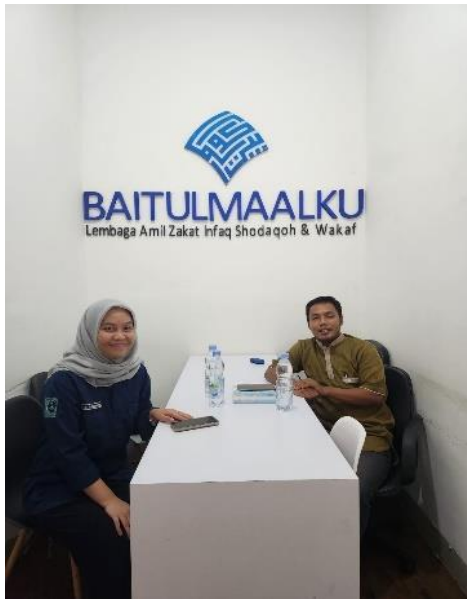
Lampiran 8.7 Wawancara informan