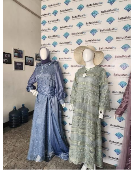
Lampiran 8.6. Hasil pelatihan