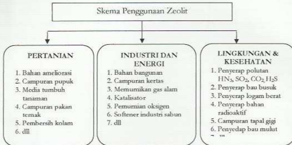
Gambar 1. Skema penggunaan zeolit

Zeolit pelet yang sudah kontak dengan air, akan berubah menjadi bubuk kembali dan mengikat pupuk karena terjadinya proses pertukaran ion dan adsorpsi. Oleh sebab itu, pupuk tidak mudah hanyut oleh aliran air dan efisiensi penggunaan pupuk meningkat. Selain itu, zeolit dapat juga digabung dengan bahan lain seperti fosfat, dolomit, dan KCl membentuk pupuk majemuk.