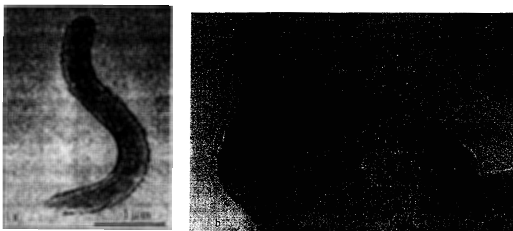
Gambar 1. Bakteri magnet Magnetospirillum magneticum AMB-1 dengan magnetosom membentuk rantai searah panjang sel (a) (Wahyudi et al. 2003) dan sebuah partikel magnet, magnetit, yang diselubungi oleh membran (ditandai anak panah) (b) yang diamati menggunakan mikroskop elektron (Matsunaga et al. 1991).

Biomineralisasi kristal magnet tidaklah terjadi secara konstitutif, melainkan bergantung pada kondisi pertumbuhannya. Di samping ketersediaan besi (dalam jumlah mikromolar), kondisi mikroaerob sangat diperlukan untuk pembentukan magnetosom pada Magnetospirillum (Blakemore et al. 1985; Matsunaga 1991). Magnetospirillum magneticum AMB-1 tidak membentuk magnetosom selama pertumbuhan dalam kondisi aerob, tetapi akan mulai memproduksi magnetosom dengan segera setelah ditumbuhkan dalam keadaan mikroaerob ( O_2 1-3%). Dalam usaha untuk mengungkap keterkaitan antara sistem transpor elektron dalam penggunaan nitrat dan oksigen dengan pembentukan magnetosom dilakukan uji sitokrom pada