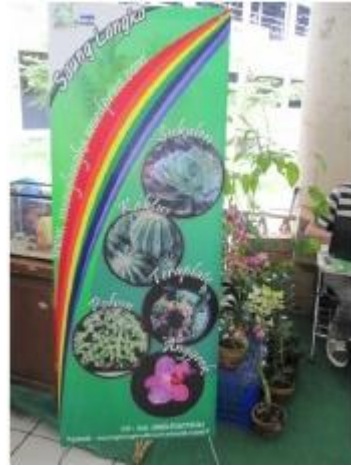
Kondisi saat pameran Saung Langka berlangsung