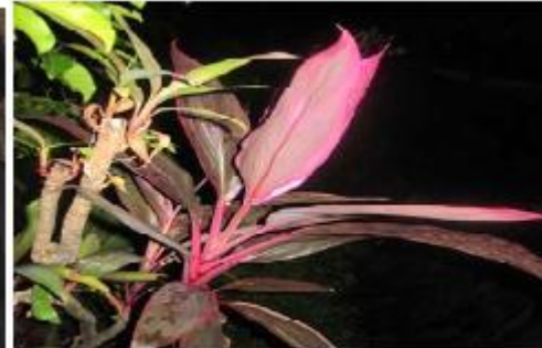
Kokolot Kampung Budaya Sindang Barang Tanaman Ritual Tandır Hanjuang