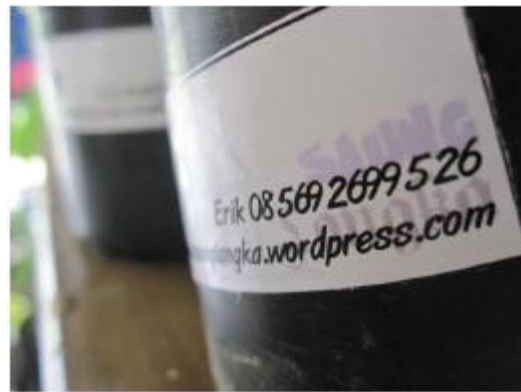
Logo dan Stiker Saung Langka