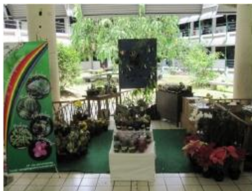
Desain dan tata letak saat mengikuti pameran