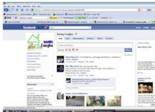
Media Promosi Saung Langka ( www.tokopedia.com dan group facebook)