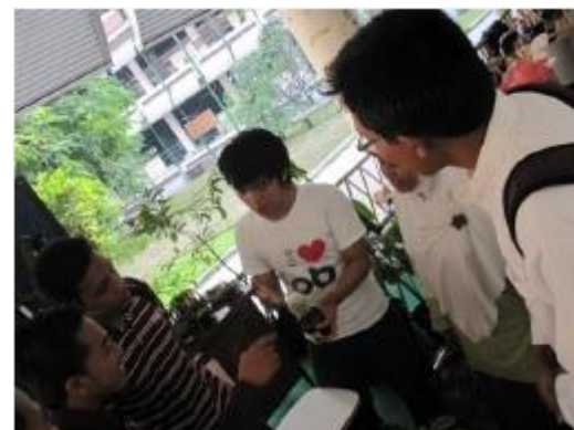
Penjelasan kepada konsumen