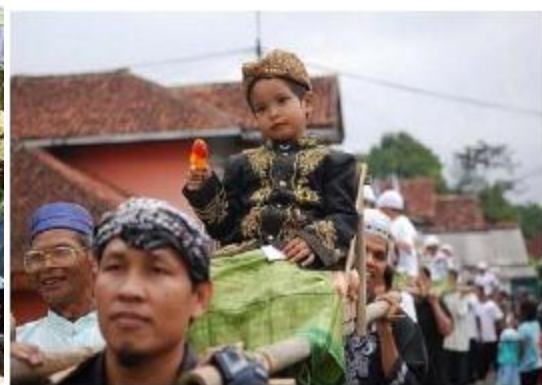
Kegiatan saat upacara pernikahan dan Perayaan Sunatan