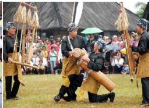
Kegiatan saat upacara Seren Taun