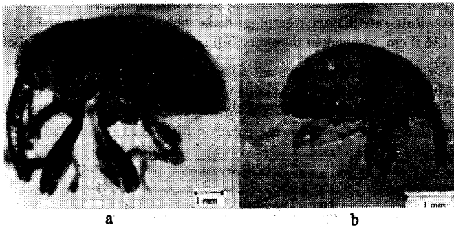
Gambar 2. Serangga perusak biji beberapa jenis Shorea : a. Alcidodes sp., b. Nanophyes sp.

Serangga Perusak Biji Meranti. Serangga perusak biji meranti yang ditemukan dua macam yaitu kumbang Alcidodes sp. dan Nanophyes sp. (Coleoptera, Curculionidae) (Gambar 2a, b). Alcidodes sp. menyerang biji S. gibbosa , S. johorensis , dan S. ovalis sedangkan Nanophyes sp. hanya menyerang biji S. ovalis saja. Serangga lain yang ditemukan dari hasil pemeliharaan ialah ngengat (Lepidoptera) dan tawon (Hymenoptera).