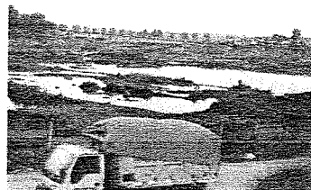
Gambar 1. Gambar Lahan dan Gedung Pabrik