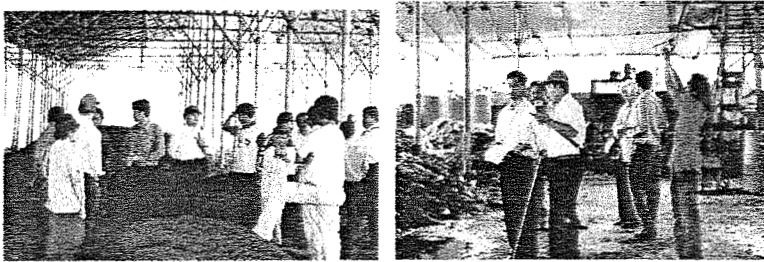
Gambar 3. Kunjungan dan pengawasan oleh tim teknis nasional dan dari Bank Dunia.