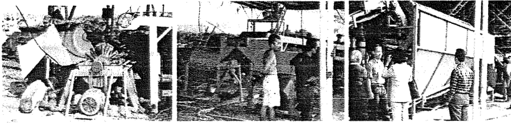
Gambar 2. Alat-alat produksi pengolahan sampah menjadi kompos.