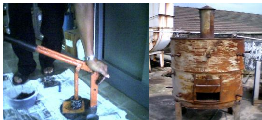
Gambar 3. (a) Alat kempa manual (b) Alat pyrolysis (Lab. Energi dan Elektrifikasi Pertanian IPB, 2008).

Pirolisis merupakan proses penguraian biomassa karena panas (Hayati et al. , 2008). Pirolisis dapat berlangsung melalui panas yang dihasilkan yaitu pada suhu lebih dari 150°. Pirolisis mempunyai manfaat untuk meningkatkan nilai kalor, mengurangi asap saat pembakaran, menurunkan kadar air dan mempermudah penyimpanan dan pendistribusian. Berdasarkan tingkatan proses pirolisa yang dilakukan, proses pirolisa dapat digolongkan menjadi pirolisa primer dan pirolisa sekunder. Pirolisa primer adalah proses yang terjadi secara langsung terhadap bahan bakunya. Pirolisa sekunder adalah proses yang terjadi pada bahan partikel yang merupakan kelanjutan dari hasil gas atau uap sebagai hasil dari pirolisa primer. Pirolisis juga dapat diartikan sebagai proses penguraian panas tanpa melibatkan gas oksigen dari udara secara langsung. Hasil pirolisis dikenal sebagai arang. Setelah diarangkan, briket harus mengalami pengeringan. Kegiatan pengeringan dilakukan untuk mengurangi kadar air. Tangki pirolisis dapat dilihat pada Gambar 3(b) .