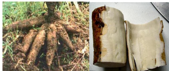
Gambar 1. (a) Singkong (b) Kulit singkong.

Selama ini, kulit ubi kayu masih jarang dimanfaatkan secara optimal. Menurut Grace (1977), kulit ubi kayu pada umumnya hanya digunakan sebagai makanan ternak dan sebagai makanan ringan seperti keripik (dengan cara digoreng). Kulit ubi kayu dengan mudah dapat dipisahkan dari umbinya dengan ketebalan 2-3 mm ( Gambar 1(b) ). Menurut Grace (1977), persentase kulit ubi kayu yang dihasilkan berkisar antara 8-15% dari berat umbi yang dikupas, dengan kandungan karbohidrat sekitar 50% dari kandungan karbohidrat bagian umbinya. Menurut Henie (2008), kulit singkong memiliki rata-rata nilai kadar air sebesar 10.06-13.14%, rata-rata nilai daya serap air berkisar 82.49%-169.78%, rata-rata nilai pengembangan tebal sekitar 35.70-102.30%, dan rata-rata nilai kerapatannya berkisar 0.86-0.87g/cm 3 .