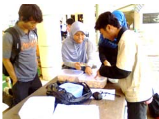
Penjualan di Bazar