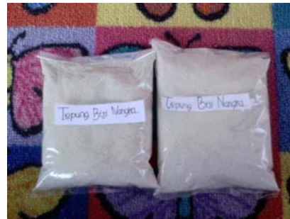
Tepung Biji Nangka