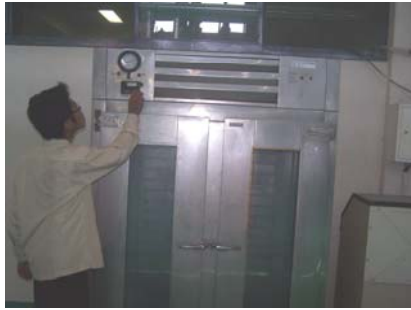
Mesin Pengering Sea Fast IPB