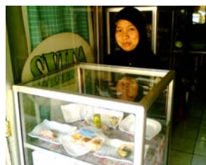
Penjualan di Toko